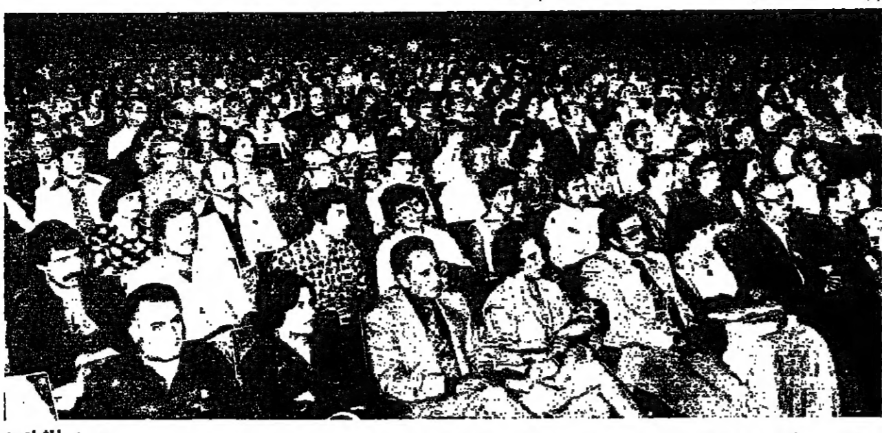
جمع المشاهدين صمت بانتظار الفرح

أخيرا ، «بترا» جاءت في مسانين كتيرة من اختصار في التفاصيل ، عرف الرجائية ان الحدث الاسسي ، لا يتحمل هوامش ورواقد . تكفروا الاحداث القرعية . تلك استحوذت الخشبية على المشاعر إبان لهات الحركة وشرة بجبهه وهجاب المشاهد .